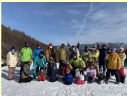
Figure 2 雪上運動会