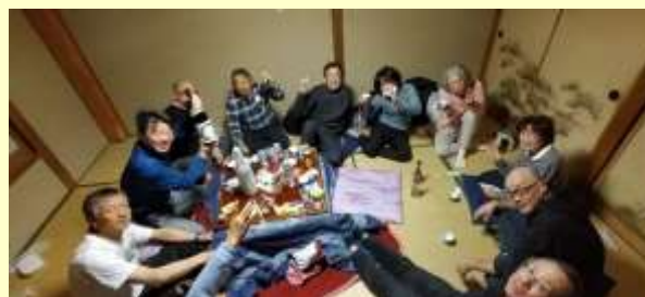
Figure 1 夜の部